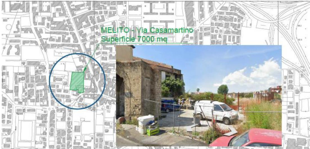
Figura 1. Collocazione territoriale area di intervento

Si riporta di seguito l'inquadramento satellitare del sito e del complesso.