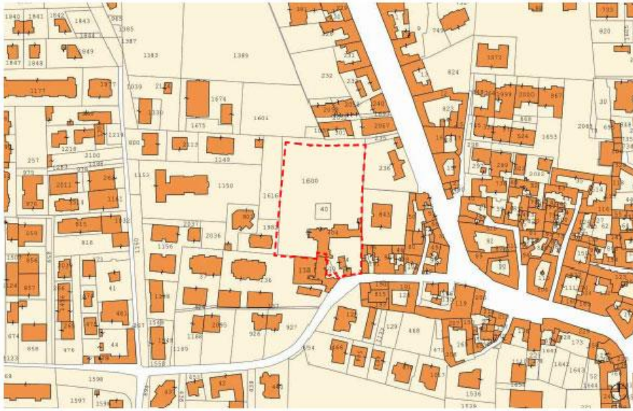
Stralcio mappa catastale - foglio 1 p.lle 1600 - 40 - 33 - 74 - 404